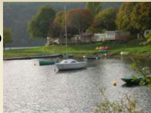
Camping municipal de Fougères