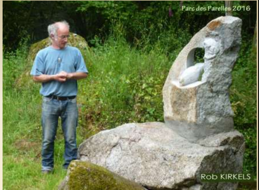
Deux sculpteurs, ont tiré parti des blocs de granit de la carrière et ont offert leurs œuvres.